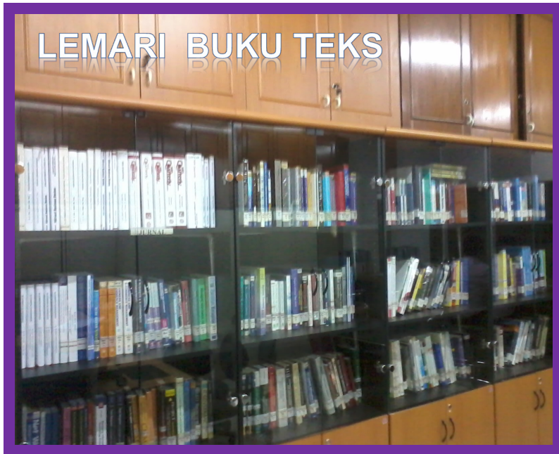
LEMARI BUKU TEKS