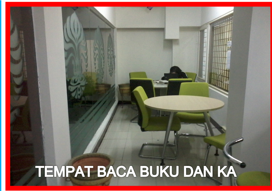
TEMPAT BACA BUKU DAN KA