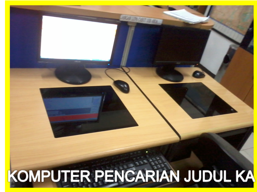
KOMPUTER PENCARIAN JUDUL KA