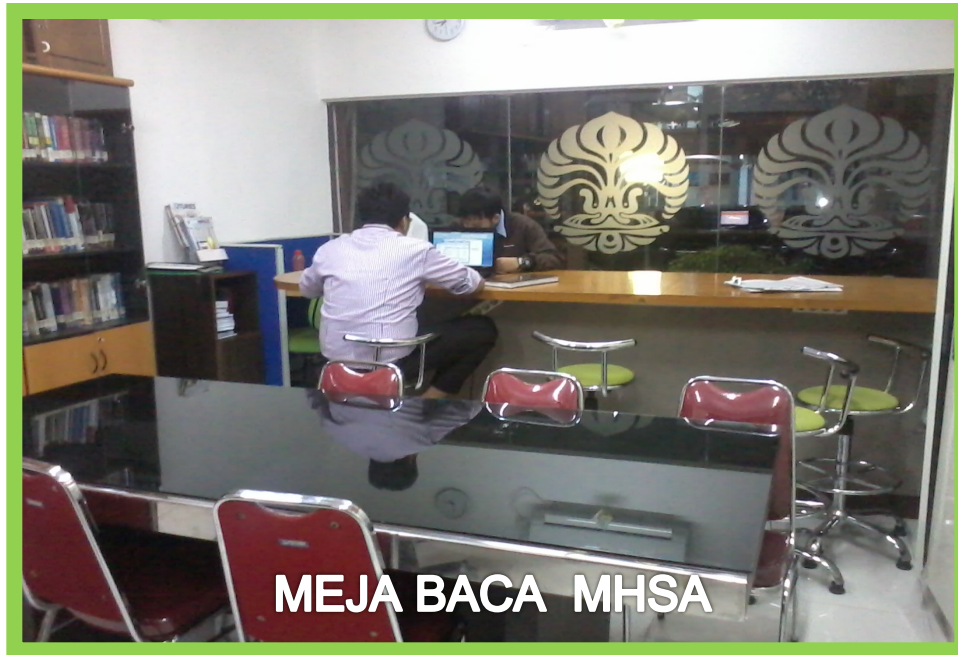
MEJA BACA MHS