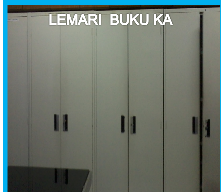
LEMARI BUKU KA